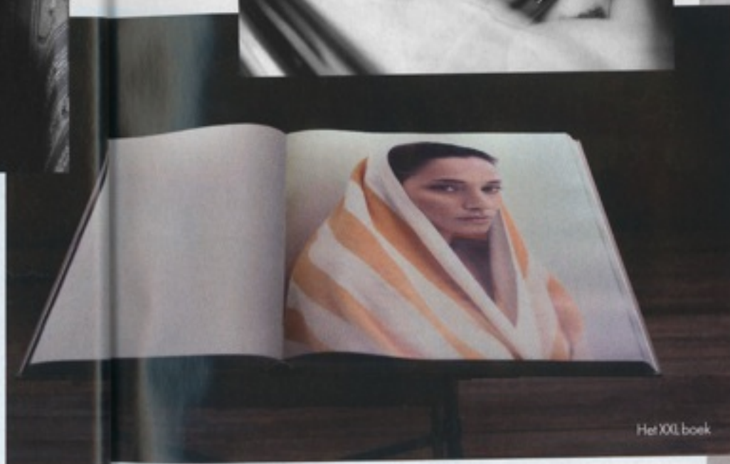
Het XXL boek