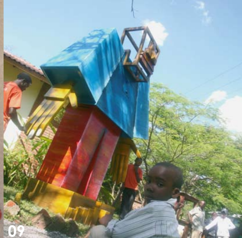
foto 5: 'The Cosmopolitan Chicken Project', 'Diversity', European space for sculpture, Regional Koen Vanmechelen © - foto 6: 'Red Jungle Fowl - Genus XY', Z33, Provinciaal Museum Hasselt, 2004, Artlist: Koen Vanmechelen © - foto 7: 'Het appèl van de kip', Museum Valkhof, Nijmegen, 2008, Artlist: Koen Vanmechelen ©