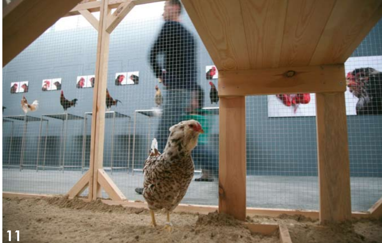
foto 11: 'The Cosmopolitan Chicken Project' - 'Against Exclusions' The 3rd moscow Biennale of Contemporary Art, Moscow (RUS), 2009